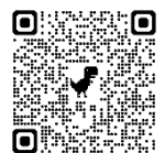
参加申込フォーム