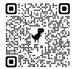
参加申込フォーム